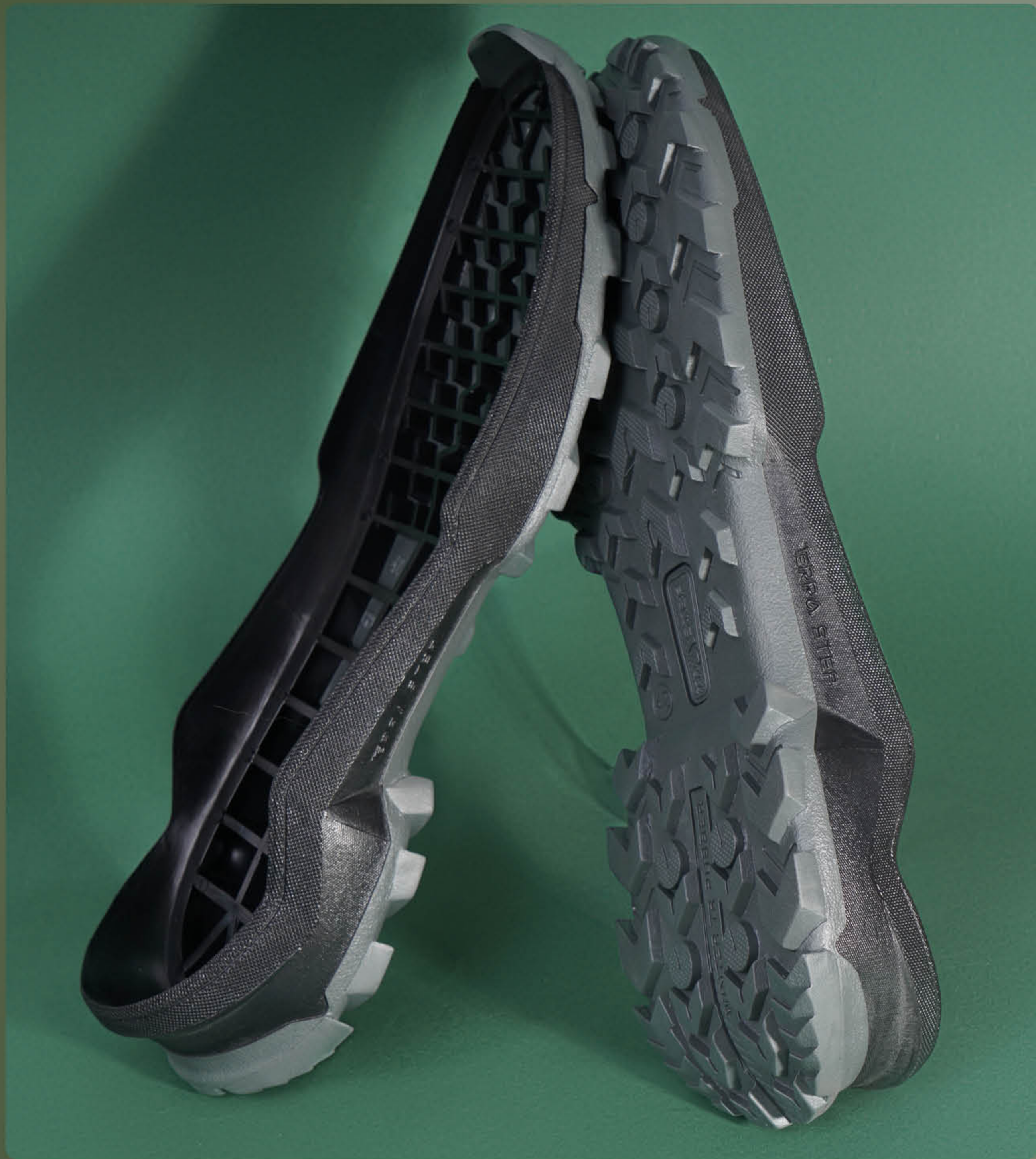
ПІДОШВА CROS-36 TR